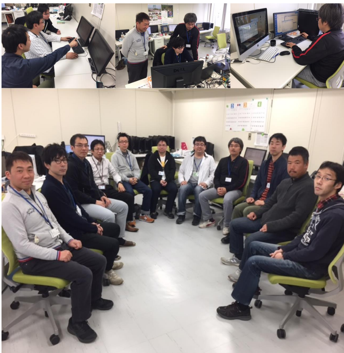
写真2、徳島 SS 本部(開発言語は、JAVA と Visual Studio .NET の開発が主体。ミドルウェアのパッケージ製品以外の自社システムや外販のシステムは、再委託せず徳島で開発し、ITの自前主義を貫く。東京/大阪の要員は除く)